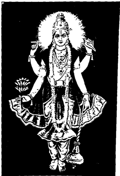
( विष्णु भगवान् )